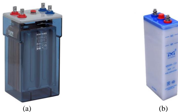
Slika 2. Prikaz olovne (a) i nikel-kadmijum (b) ćelije akumulatorske baterije

Postoje različiti tipovi akumulatorskih baterija u primeni, naročito poslednjih godina kada je tehnološki razvoj raznih elektronskih uređaja iziskivao i napredak u proizvodnji baterija. Ipak, za primenu u TS VN(SN)/SN gde su neophodne stacionarne baterije većeg kapaciteta, koriste se i dalje olovne (Pb) ili nikel-kadmijum (NiCd) akumulatorske baterije. Na slici 2 je prikazana jedna ćelija olovne (a) i nikel-kadmijum (b) baterije [4].